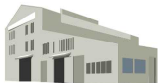
内燃機関自動車の整備設備