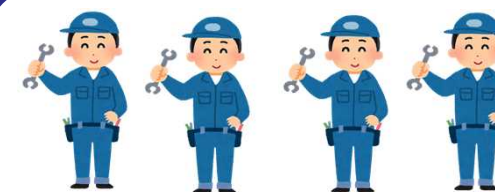
工員の研修の受講

教育のために必要な講習等 ・EV, FCV, PHEV, HVを整備するための電気自動車等の整備業務に係る特別教育費（講習費、教材費等）