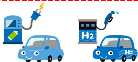
教材としてのEV・FCV・PHV・HV等や充電・充填インフラ設備